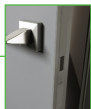
ZAMEK MAGNETYCZNY Z NAKŁADKĄ Z LOGO LEON