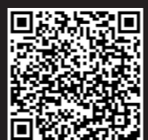
DRZWI UKRYTE SZKLANE