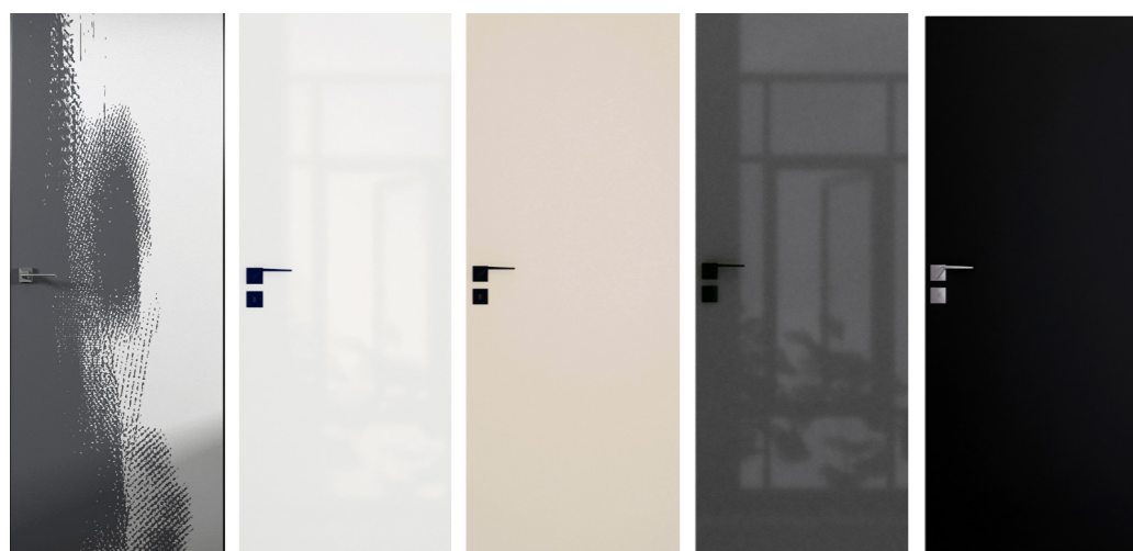
PRZYGOTOWANE DO MAŁOWANIA