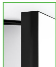
SKRZYDŁO DRZWIOWE Z RANTEM