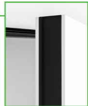
SKRZYDŁO DRZWIOWE BEZ RANTU