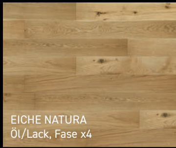
EICHE NATURA Öl/Lack, Fase x4