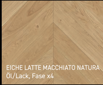
EICHE LATTE MACCHIATO NATURA Öl/Lack, Fase x4