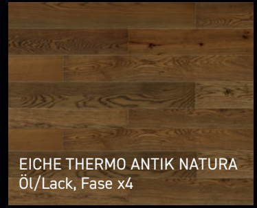
EICHE THERMO ANTIK NATURA Öl/Lack, Fase x4