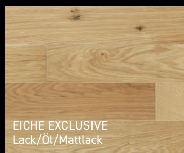
EICHE EXCLUSIVE Lack/Öl/Mattlack