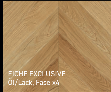
EICHE EXCLUSIVE Öl/Lack, Fase x4