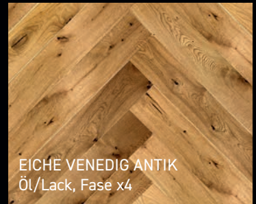
EICHE VENEDIG ANTIK Öl/Lack, Fase x4