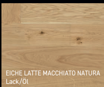
EICHE LATTE MACCHIATO NATURA Lack/Öl

Mehr Farben finden Sie bei den Händlern oder auf unserer Internetseite www.finishparkiet.com.pl