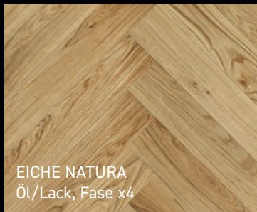
EICHE NATURA Öl/Lack, Fase x4