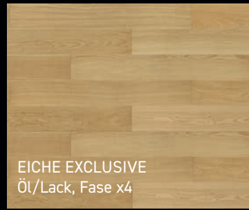
EICHE EXCLUSIVE Öl/Lack, Fase x4