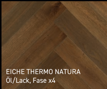
EICHE THERMO NATURA Öl/Lack, Fase x4