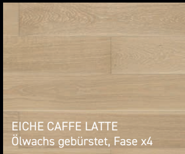
EICHE CAFFE LATTE Ölwachs gebürstet, Fase x4