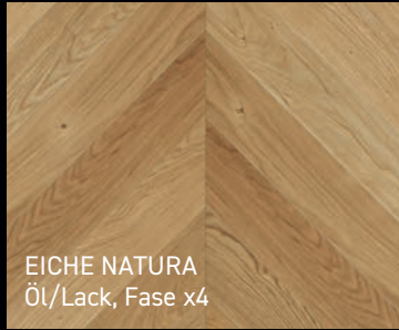
EICHE NATURA Öl/Lack, Fase x4