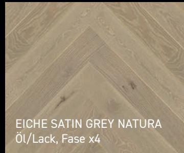
EICHE SATIN GREY NATURA Öl/Lack, Fase x4