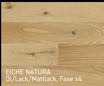
EICHE NATURA Öl/Lack/Mattlack, Fase x4