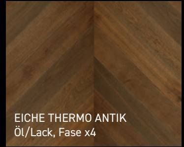
EICHE THERMO ANTIK Öl/Lack, Fase x4