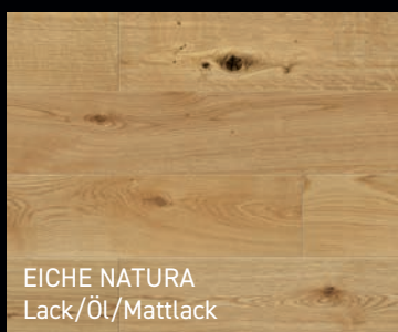
EICHE NATURA Lack/Öl/Mattlack