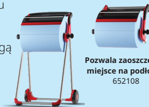
Pozwala zaoszczędzić miejsce na podłodze 652108