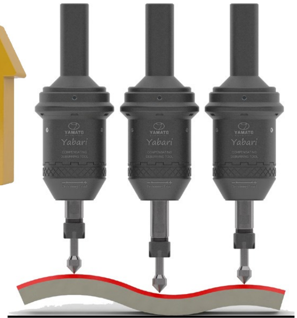
10mm OSIOWEJ PODATNOŚCI NA PCHANIU