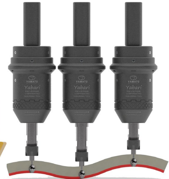
10mm OSIOWEJ PODATNOŚCI NA CIĄgniĘCIU WSTECZNYM