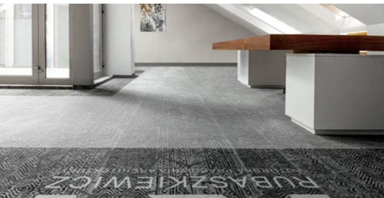
KM Rubaszkiewicz WARSZAWA