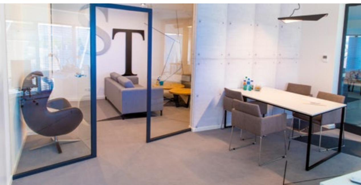
Szklane Tarasy RZESZÓW