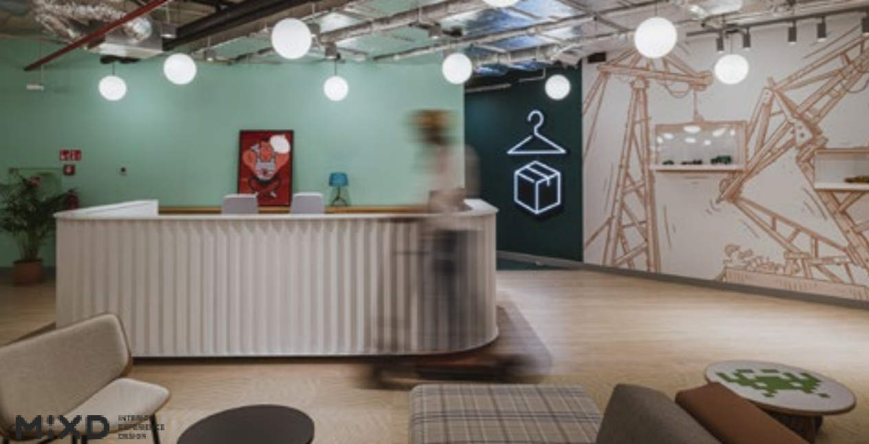
InfiniT Codelab SZCZECIN