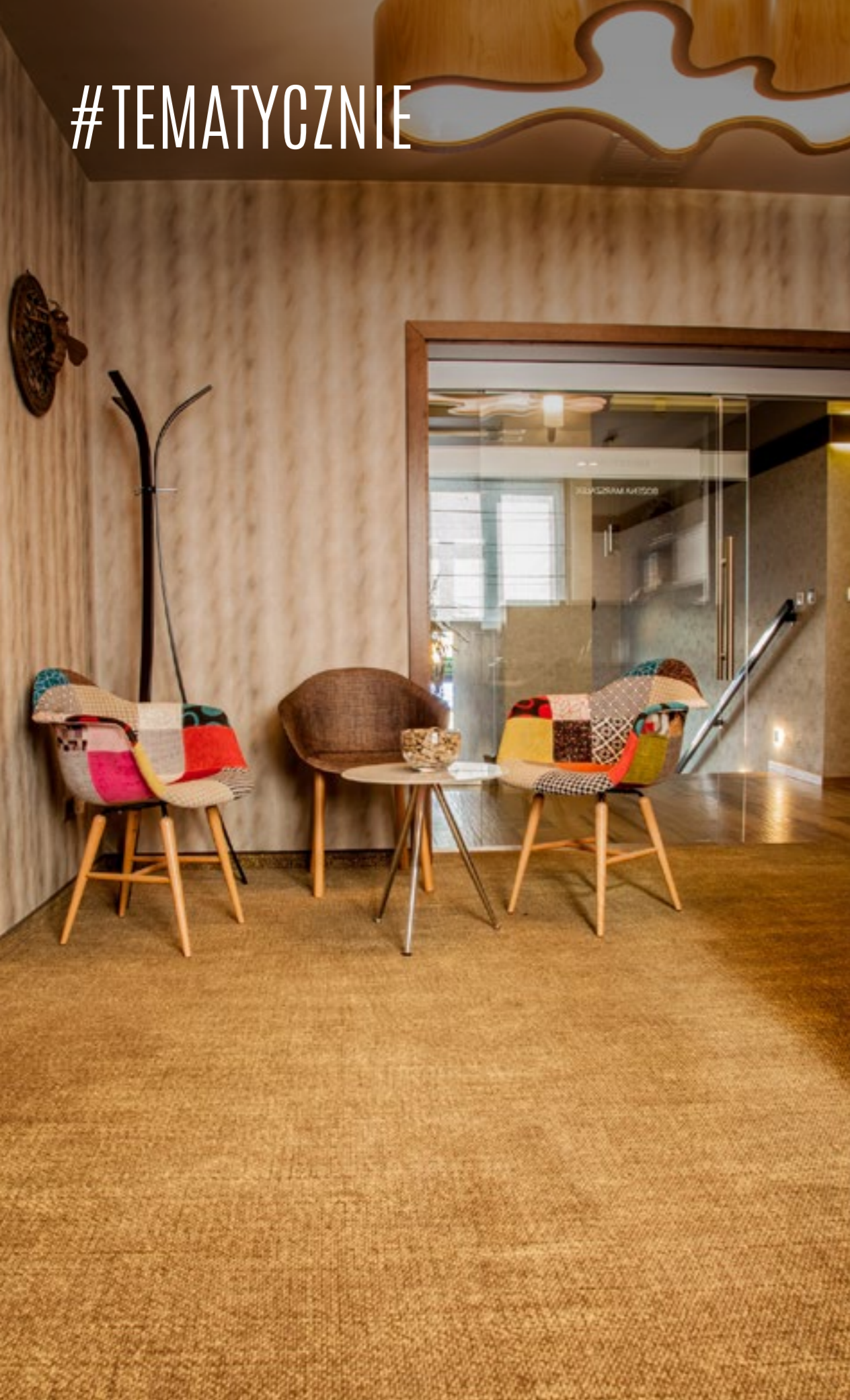
Przedsiębiorstwo Pszczelarskie SUŁKOWICE