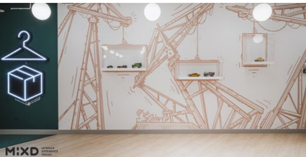
InfiniT Codelab SZCZECIN