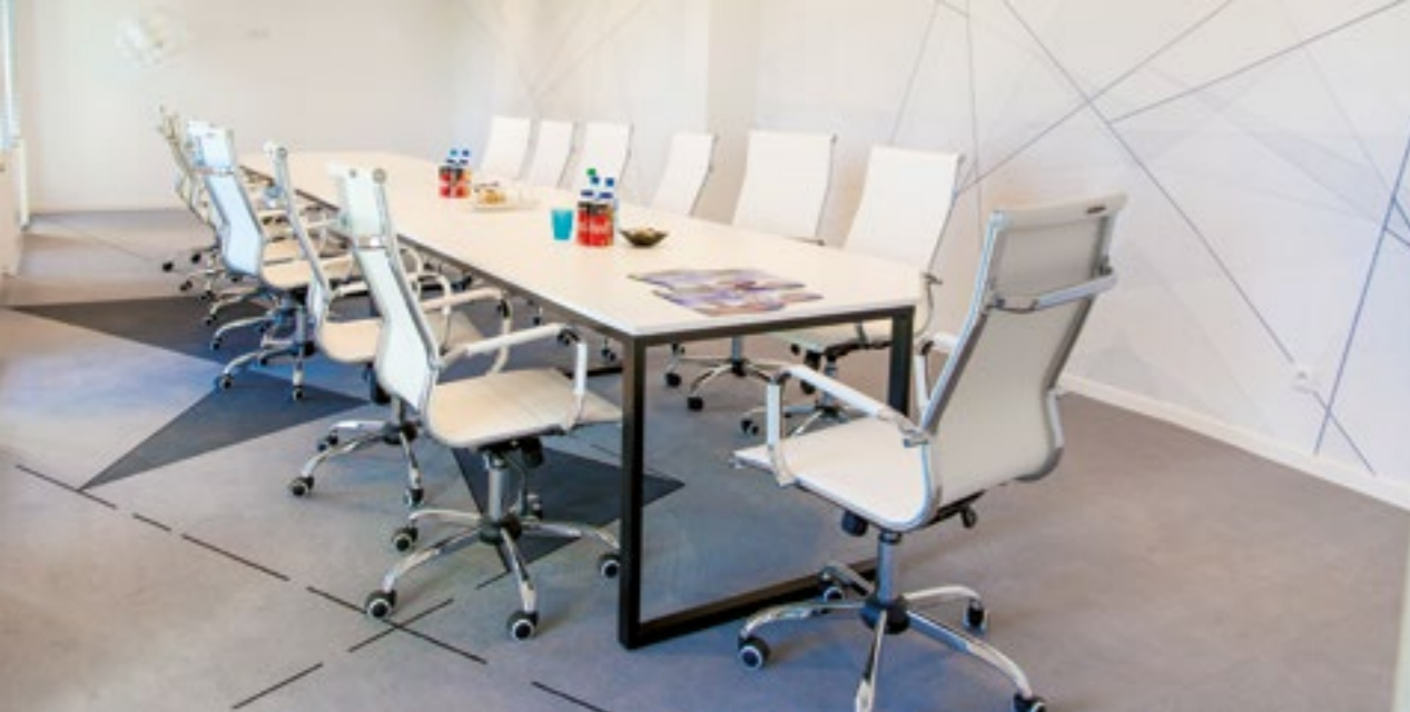
Szklane Tarasy RZESZÓW