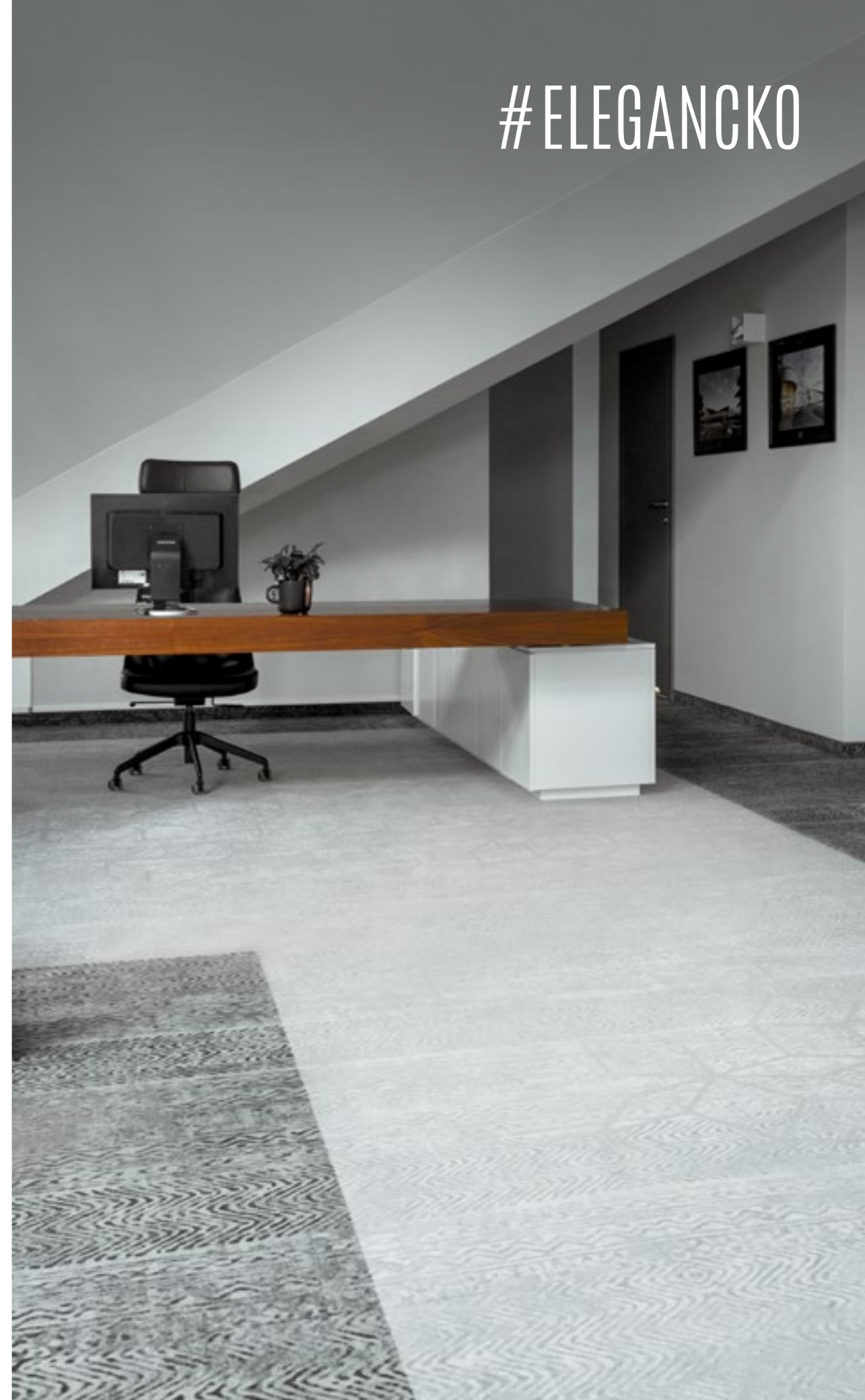
KM Rubaszkiewicz WARSZAWA