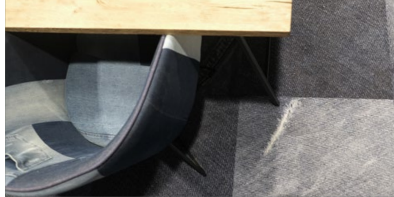
Biuro Brandbq Sp. z o.o. KRAKÓW