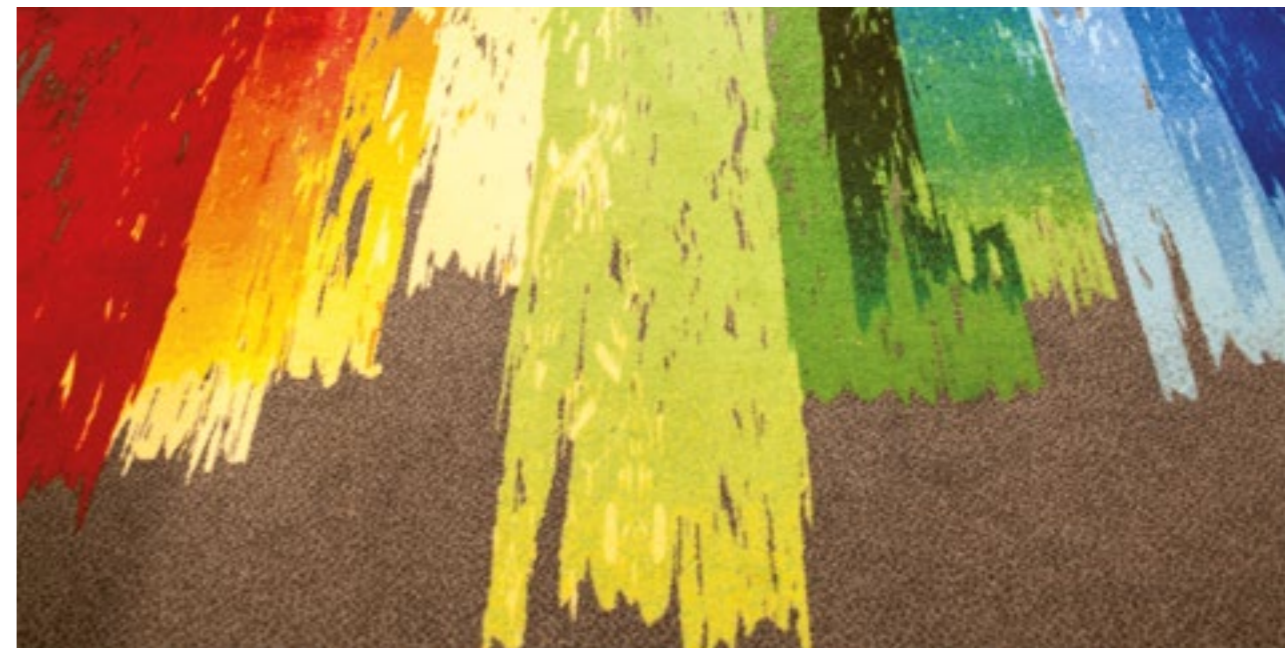
Drukarnia Eticod KATOWICE