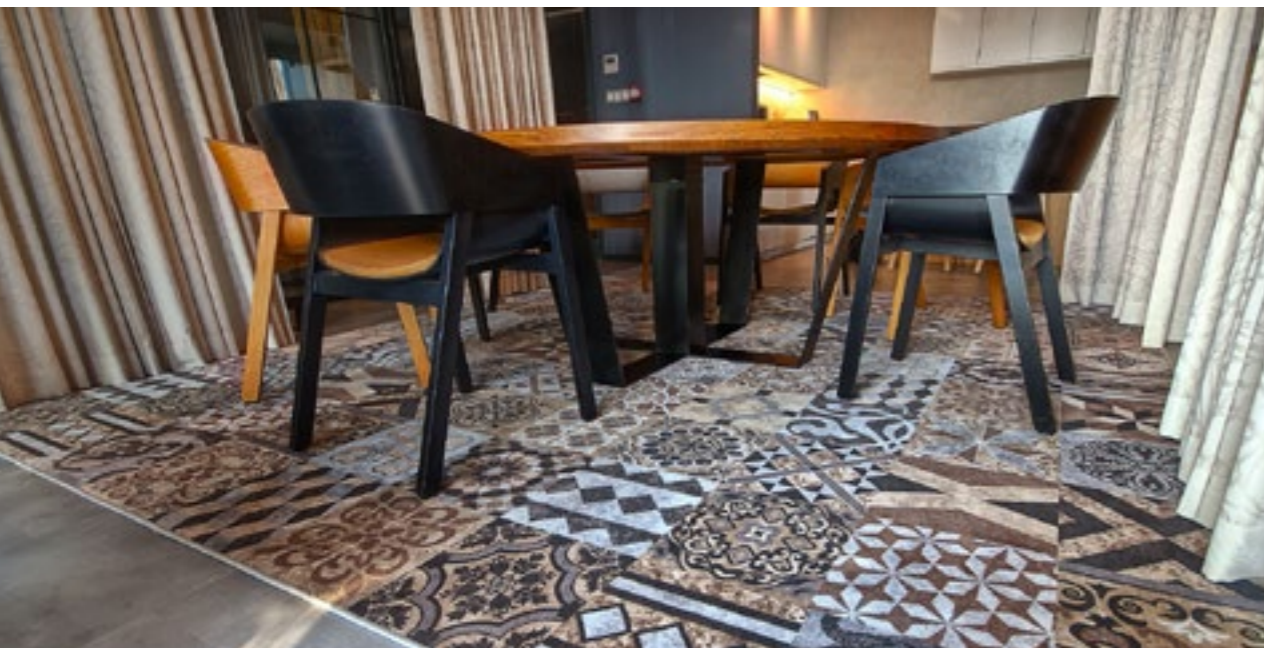
Biuro Benaco KRAKÓW