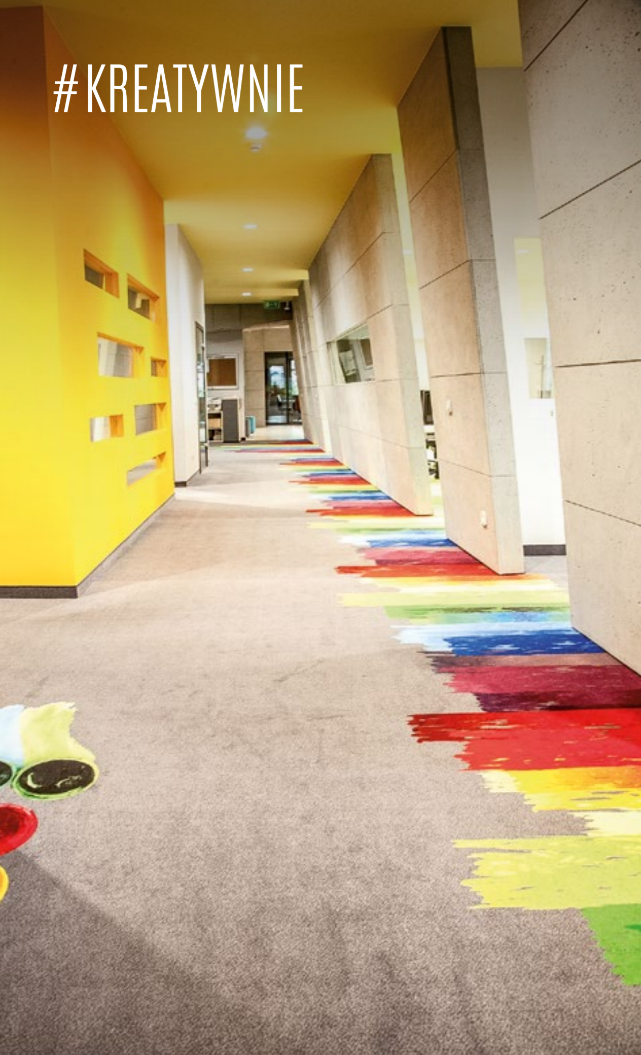
Drukarnia Eticod KATOWICE