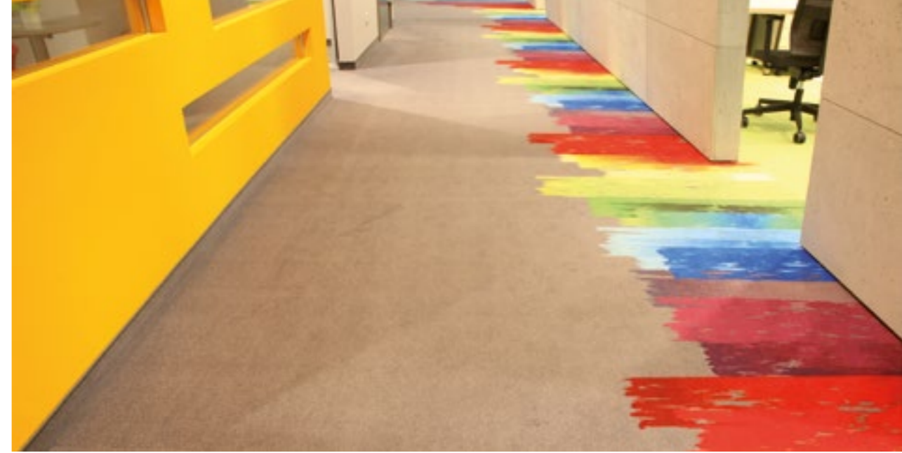
Drukarnia Eticod KATOWICE