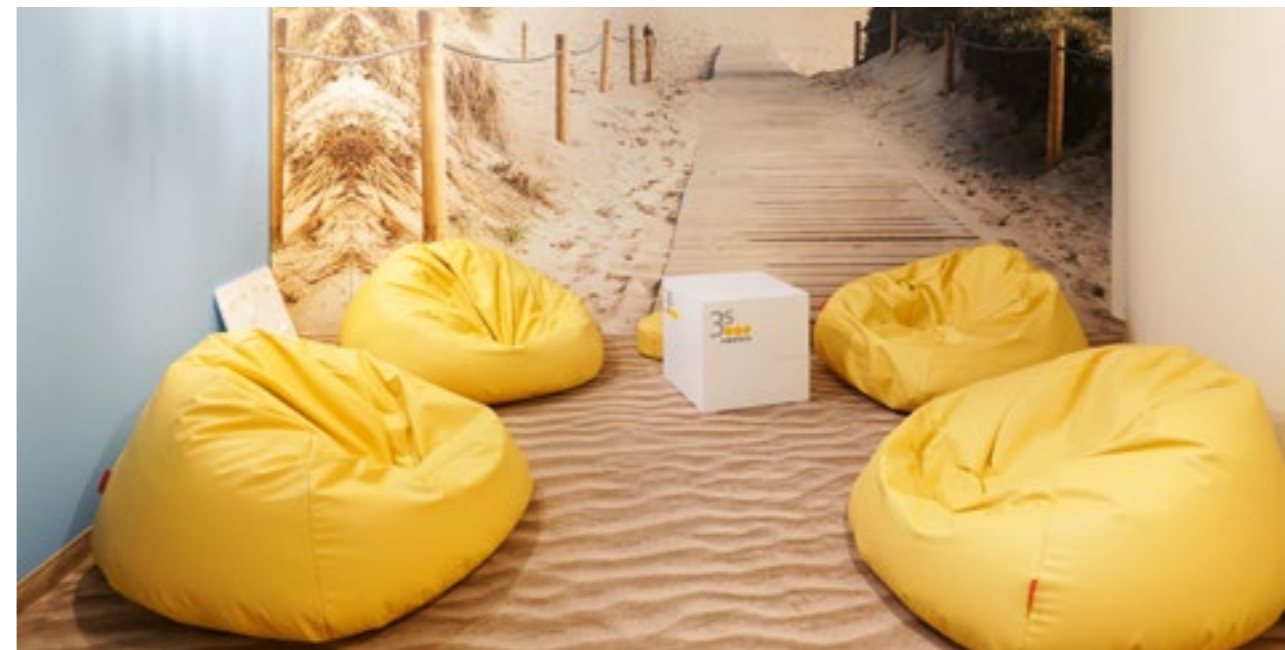
3S FIBERTECH KRAKÓW