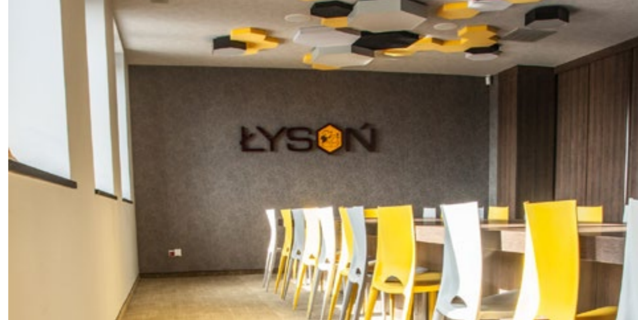
Przedsiębiorstwo Pszczelarskie SUŁKOWICE