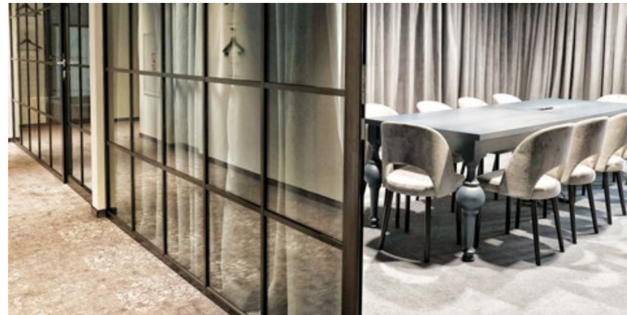
Biuro Brandbq Sp. z o.o. KRAKÓW