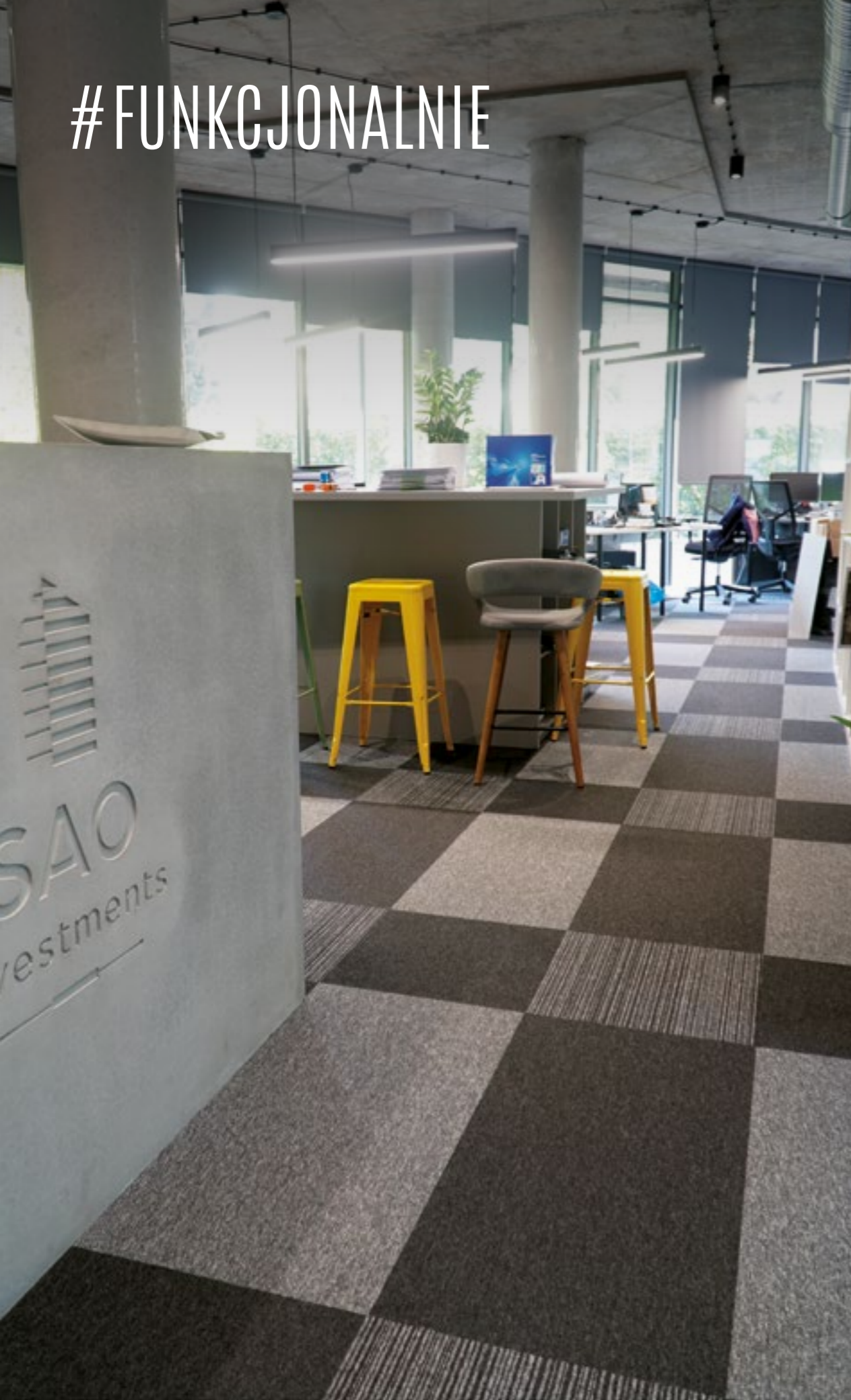
SAO Investments KRAKÓW