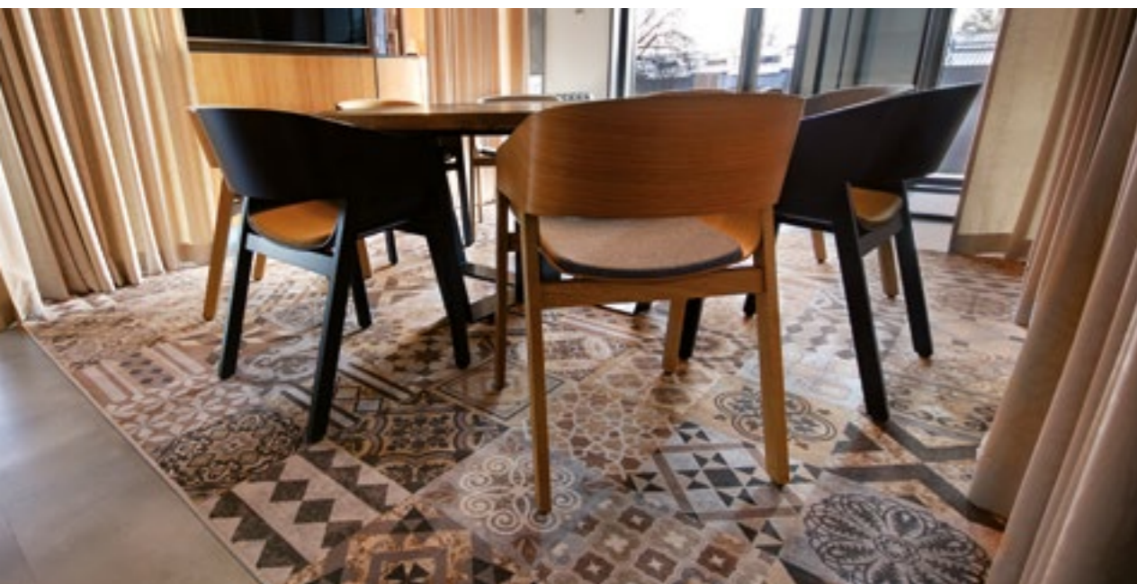
Biuro Benaco KRAKÓW