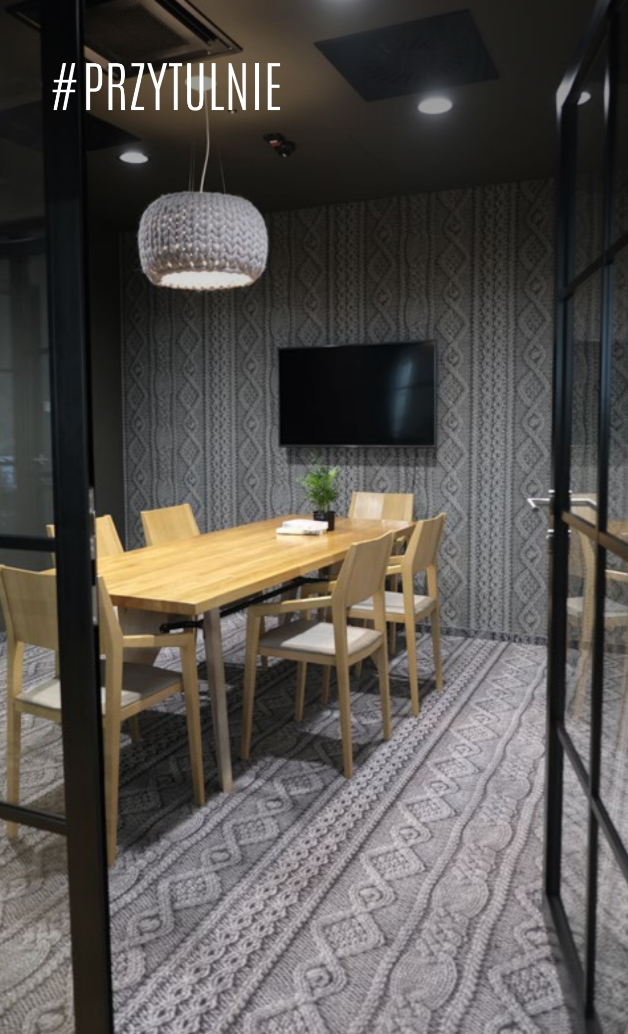
Biuro Brandbq Sp. z o.o. KRAKÓW