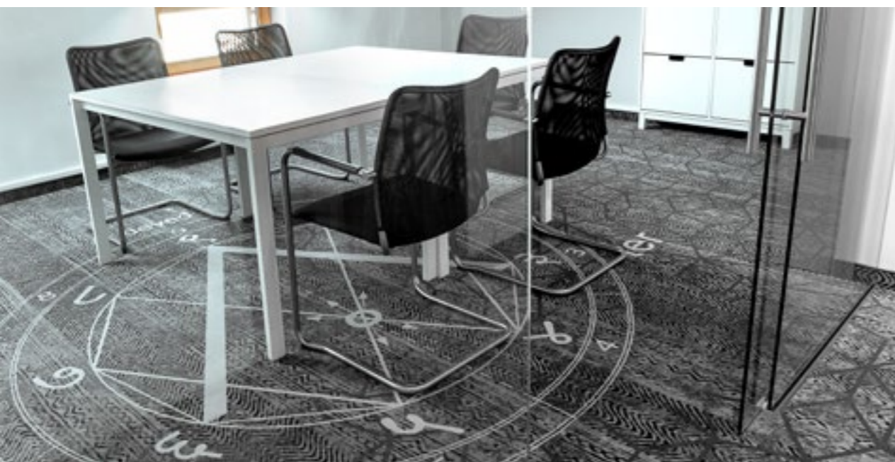
KM Rubaszkiewicz WARSZAWA