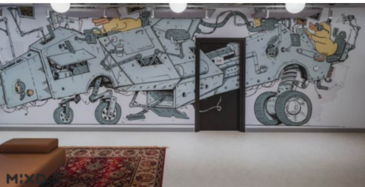
InfiniT Codelab SZCZECIN