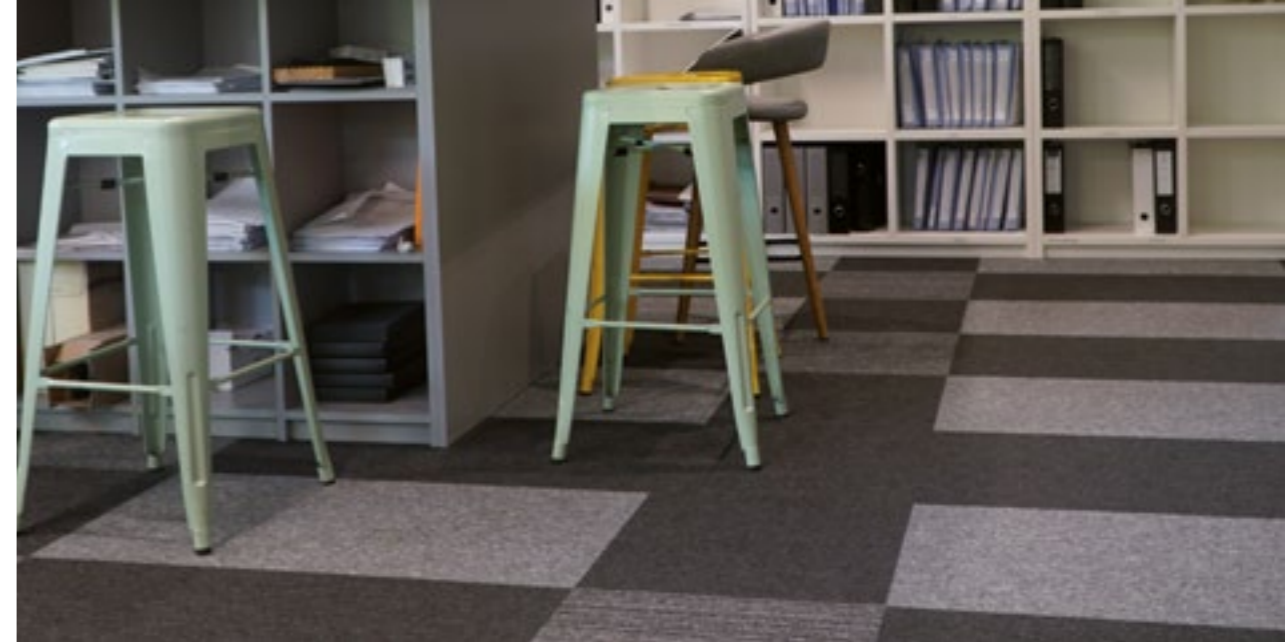
SAO Investments KRAKÓW