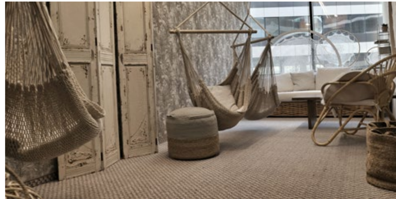
Biuro Brandbq Sp. z o.o. KRAKÓW