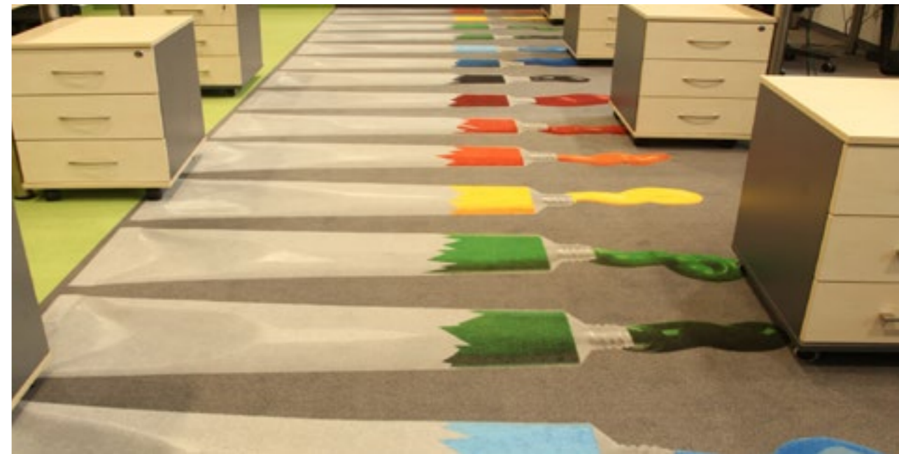
Drukarnia Eticod KATOWICE