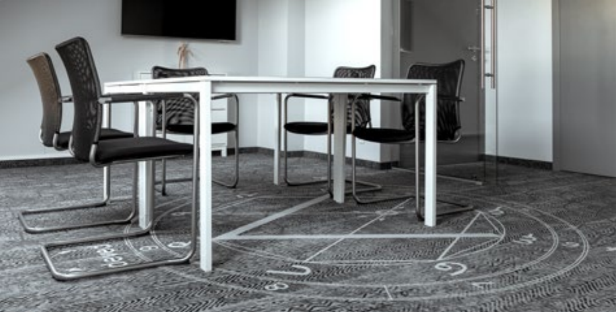
KM Rubaszkiewicz WARSZAWA