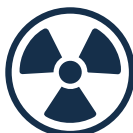
ALGORYTM RADIOLOGICZNY AI