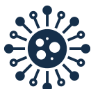
ALGORYTM WENERYCZNY AI